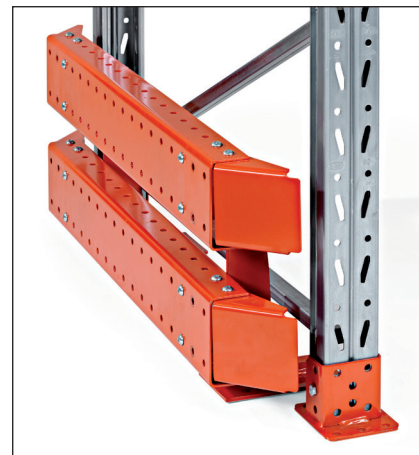
Ákeyrsluvörn hæð 400 mm – fyrir endaramma og lyftaraganga. Fást bæði fyrir einfalda og tvöfalda rekka. Hæð 400 mm.