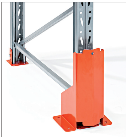
Rammavörn hæð 400 mm - til festingar í gólf