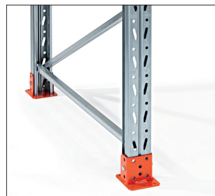
Fótplata – mjög góð festing í gólf og ver neðsta hluta stoðarinnar.