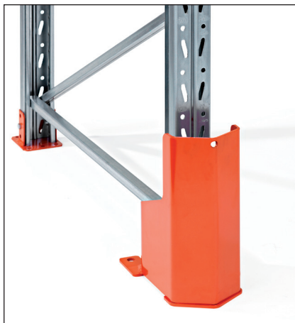
Rammavörn hæð 400 mm með PU-fjöður – til festingar í gólf. Notast með PU-fjöður