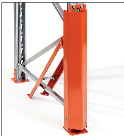
Stoðarstyrking 90/110 há - til festingar með fótplötu. Gefur bestu vörn á þeim hluta stoðarinnar sem helst verður fyrir hnjaski. Hæð 760 mm.