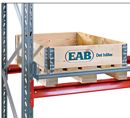
Öryggisslá lárétt - fest aftan á rekka, varnar því að bretti sé ýtt of langt inn í rekkan.