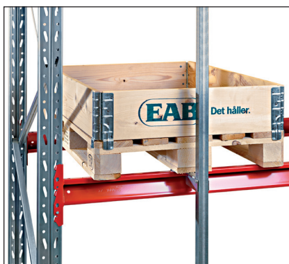
Öryggisslá lóðrétt - fest aftan á rekka, varnar því að bretti sé ýtt of langt inn í rekkan.