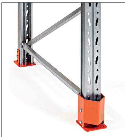
Stoðarstyrking 90/110 lág – til festingar með fótplötu. Ver stoðina mjög vel án þess að taka nokkuð aukapláss. Hæð 150 mm.