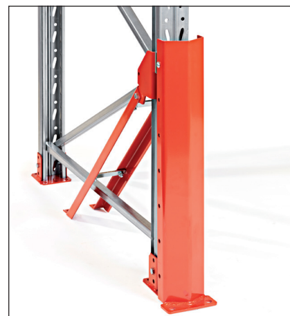
Stoðarstyrking 90/110 há - festist í stoðina og gólfið. Hægt að nota þó biti sé lágt staðsettur.